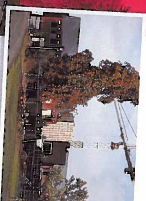
« Pavillon Les Lias » en phase de construction

Les travaux ont démarré rapidement en janvier 2011 par la construction du premier pavillon « Les Orangers ». Celui-ci a été réceptionné fin février 2013. Le démarrage des patients a eu lieu au début du mois de mars pendant que les équipes de Wust étaient déjà occupées à la construction du deuxième bâtiment à l'identique du premier.